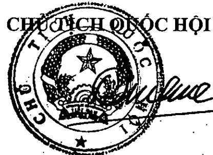
Vương Đình Huệ

Nghị quyết này được Quốc hội nước Cộng hòa xã hội chủ nghĩa Việt Nam khóa XV, kỳ họp bất thường lần thứ 5 thông qua ngày 18 tháng 01 năm 2024.