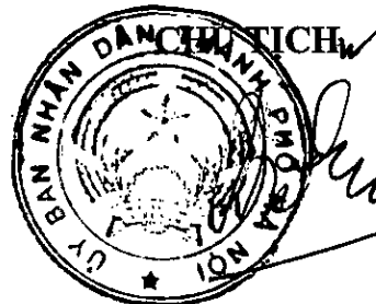
Chu Ngọc Anh